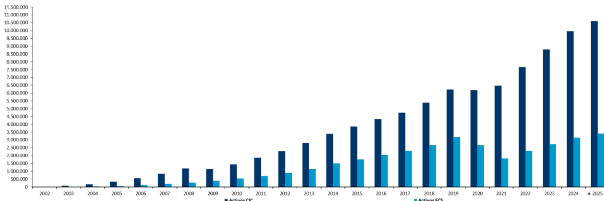
Gráfico N° 1 Evolución de los Fondos de Cesantía 1 En millones de pesos 2

(* ) Valor de los activos al 31 de julio de 2025.